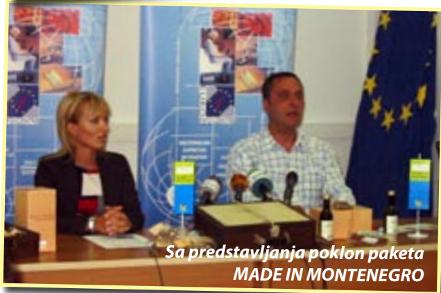
Sa predstavljanja poklon paketa MADE IN MONTENEGRO