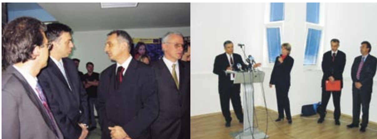
Sa otvaranja EICC-a, 8. maj 2002. godine