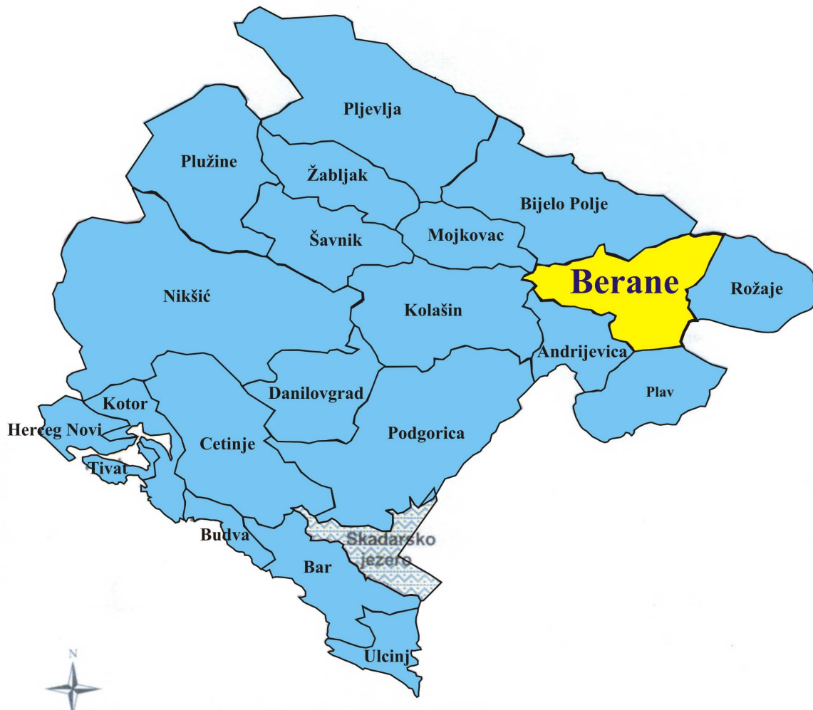
Slika 1.1. Položaj opštine Berane u Crnoj Gori

Duž rijeke Lim (idući ka jugu),Berane je prirodno otvoreno prema Andrijevici i Plavu,dok kroz Tivransku klisuru ima izlaz prema Bijelom Polju.