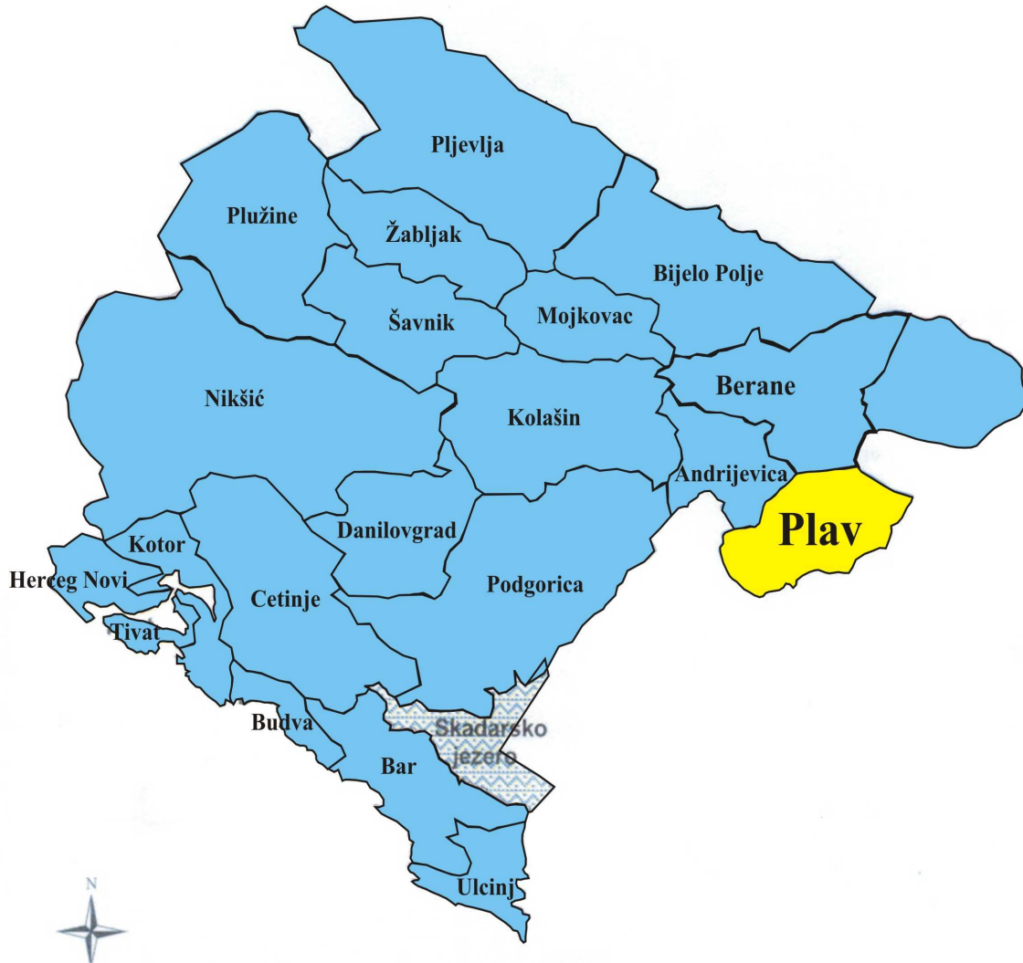
Slika 1. Položaj opštine Plav u Crnoj Gori